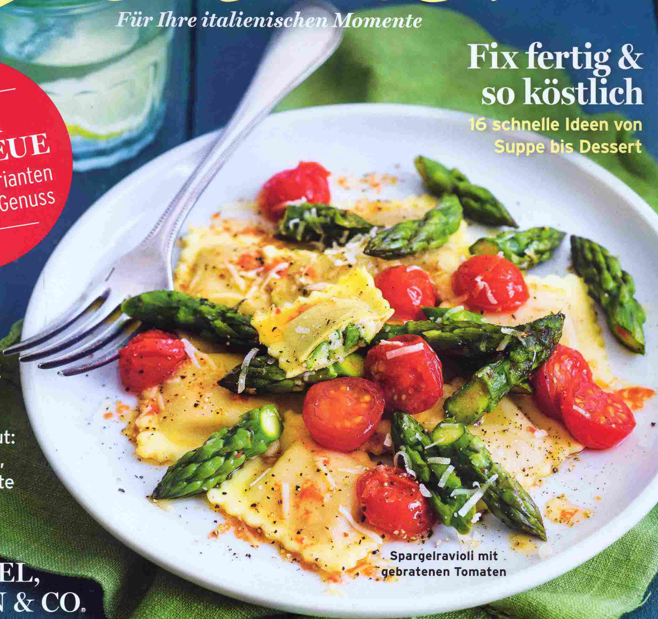
Spargelravioli mit gebratenen Tomaten

SCHÄTZE DER SAISON: Frisches Gemüse • Zarter Spinat • Rhabarber – viermal anders FÜR GÄSTE: Feine Gerichte mit Lamm, Kaninchen und mehr • Torten, die Eindruck machen